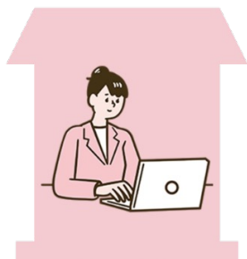
居宅介護 支援事業所