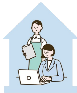
居宅サービス 事業所

居宅介護支援事業所と居宅サービス事業所とのケアプランのやりとりを、オンラインで完結できる仕組みです。 紙のやりとりの大変さは過去のものに。